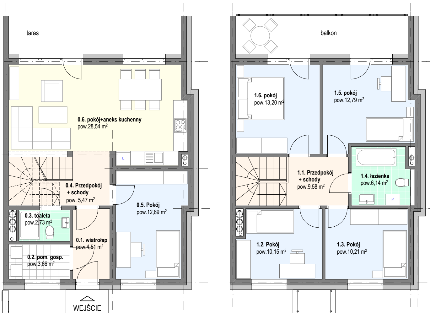
PARTER 57,81 m 2